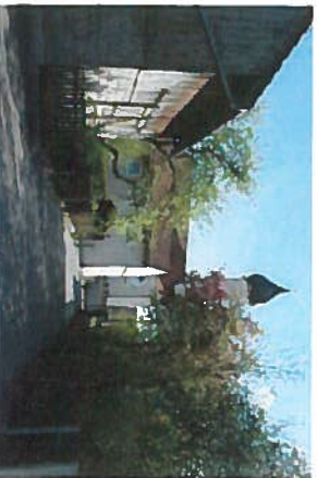
Prägende Grünstruktur im Straßenraum