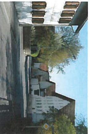
Richtung gleichständiger Baukörper