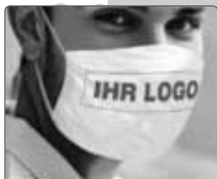
Mund- und Nasenmasken

Jetzt online konfigurieren und bestellen