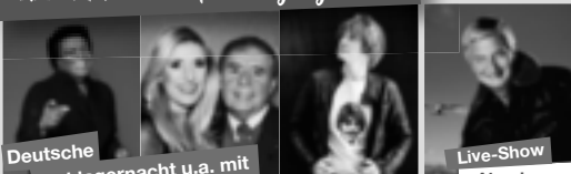
Deutsche Schlager Roberto Blanco, Stefanie & Eberhard Hertel und Mickie Krause