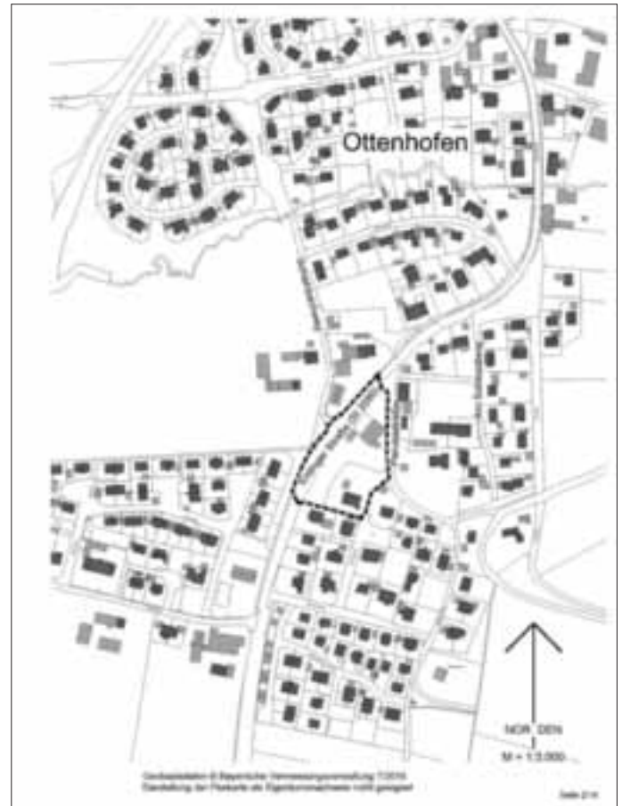
Übersichtsplan Ottenhofen-Süd, 3. Änderung Plangebiet, ohne Maßstab, Quelle: Geobasisdaten © Bayerische Vermessungsverwaltung 2018

4 (teilweise) alle in der Gemarkung Ottenhofen. Der Geltungsbereich des Bebauungsplans ist aus nachfolgendem Lageplan ersichtlich, der Bestandteil der Bekanntmachung ist: