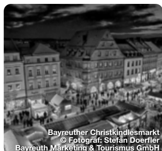
Bayreuther Christkindlesmarkt

TreffpunktDeutschland.de/weihnachtsmaerkte