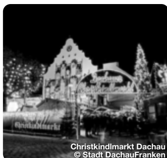
Christkindlmarkt Dachau