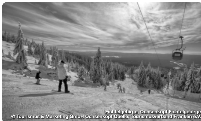
Fichtelgebirge, Ochsenkopf Fichtelgebirge