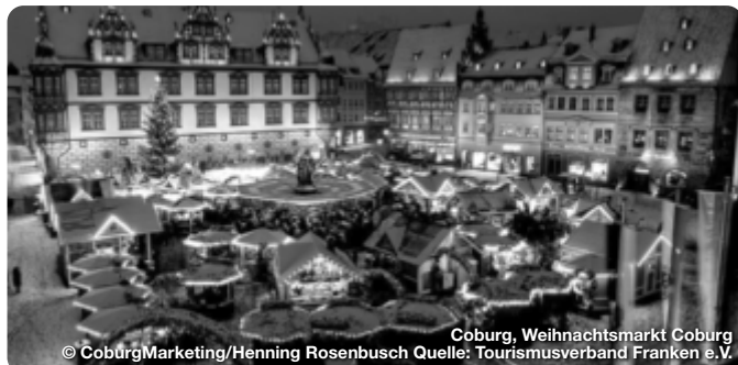
Coburg, Weihnachtsmarkt Coburg

Reiseführer. Reisemagazine. Freizeittipps. News.