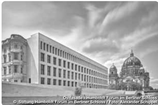
Ostfasade - Humboldt Forum im Berliner Schloss

Reiseführer. Reisemagazine. Freizeittipps.