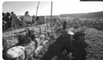
Weingut Glaser