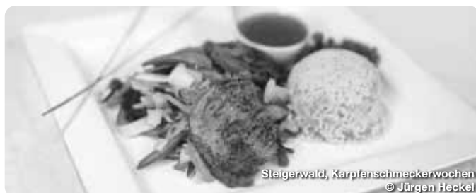
Steigerwald, Karpfenschmeckerwochen