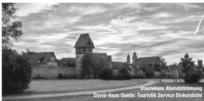
Inselwiese Abendstimmung David-Haas

Bereits von Ferne zeichnet sich die Silhouette der Stadt mit dem mächtigen Münster St. Georg ab. Türme und Tore umgeben eine der „am besten erhaltenen mittelalterlichen Städte Deutschlands“, wie Kunsthistoriker sagen. Ein Wochenmagazin kürte die Altstadt sogar zur schönsten im Lande: ein Geheimtipp und „Zeitreiseziel“ so die Redaktion. Andere finden hier ihren „Traumort“, wie das Magazin GEO. treffpunktdeutschland.de/dinkelsbuehl