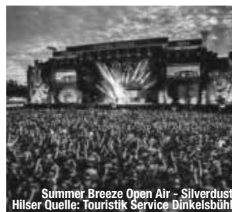
Summer Breeze Open Air - Silverdust Hilser