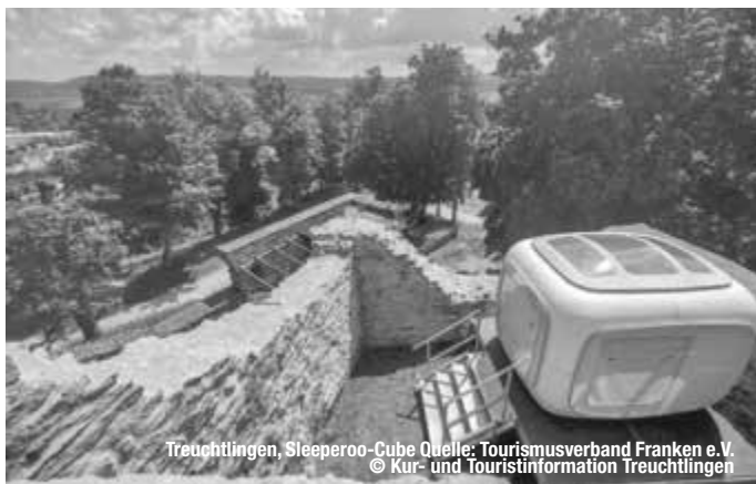
Treuchtlingen, Sleeperoo-Cube

Eine Burg-Übernachtung der mystischen Art bietet die Thermenstadt Treuchtlingen. Der Schlaf-Cube der Firma sleeperoo ermöglicht auf der Treuchtlinger Burgruine eine Übernachtung, die so bisher nicht vorstellbar war. Die kleine Schlafkabine thront inmitten der historischen Gewölbe der Ruine. Die Gäste fühlen sich so wie im 12. Jahrhundert. Dank dreier großer Panoramafenster und eines transparenten Dachs genießen sie eine herrliche Aussicht und schlafen unterm Sternenhimmel. Der Schlaf-Cube ist mit nachhaltigen Materialien ausgestattet, wie einer 1,60 auf 2 Meter großen Sojaöl-kernmatratze sowie kuscheliger Bettwäsche aus Schafschurwolle oder Bambus. Auch bei der „Chillbox“, die mit Bio-Snacks und Getränken sowie allerlei Nützlichem für die Nacht bestückt ist, wurde auf nachhaltiges Material und Produkte geachtet. Die Cubes selbst werden aus zu 100 Prozent recyclefähigem Kunststoff in Deutschland gefertigt. Mit der besonderen Übernachtung ist es aber nicht getan: Auf Entdeckungstour finden die Gäste im Burghof die alte Zisterne und die ziegelgepflasterte Herdplatte der alten Burgküche. Wanderer und Mountainbiker kommen beim Burgberg und seinen tief ins Tal fallenden Hängen auf ihre Kosten – der nahegelegene Trailpark „Heumödertrails“ reizt Abenteuerer und Naturgenießer. treffpunktDeutschland.de/treuchtlingen