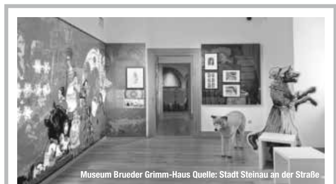
Museum Brueder Grimm-Haus

Eine Burg-Übernachtung der mystischen Art bietet die Thermenstadt Treuchtlingen. Der Schlaf-Cube der Firma sleeperoo ermöglicht auf der Treuchtlinger Burgruine eine Übernachtung, die so bisher nicht vorstellbar war. Die kleine Schlafkabine thront inmitten der historischen Gewölbe der Ruine. Die Gäste fühlen sich so wie im 12. Jahrhundert. Dank dreier großer Panoramafenster und eines transparenten Dachs genießen sie eine herrliche Aussicht und schlafen unterm Sternenhimmel. Der Schlaf-Cube ist mit nachhaltigen Materialien ausgestattet, wie einer 1,60 auf 2 Meter großen Sojaöl-kernmatratze sowie kuscheliger Bettwäsche aus Schafschurwolle oder Bambus. Auch bei der „Chillbox“, die mit Bio-Snacks und Getränken sowie allerlei Nützlichem für die Nacht bestückt ist, wurde auf nachhaltiges Material und Produkte geachtet. Die Cubes selbst werden aus zu 100 Prozent recyclefähigem Kunststoff in Deutschland gefertigt. Mit der besonderen Übernachtung ist es aber nicht getan: Auf Entdeckungstour finden die Gäste im Burghof die alte Zisterne und die ziegelgepflasterte Herdplatte der alten Burgküche. Wanderer und Mountainbiker kommen beim Burgberg und seinen tief ins Tal fallenden Hängen auf ihre Kosten – der nahegelegene Trailpark „Heumödertrails“ reizt Abenteuerer und Naturgenießer. treffpunktDeutschland.de/treuchtlingen