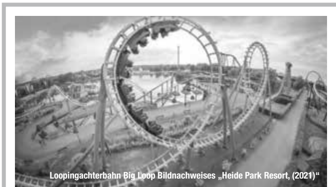
Loopingachterbahn Big Loop

häusern. Im schönsten und prächtigsten Fachwerkhaus der Stadt lebten die weltbekanntesten Brüder Grimm. Im früheren Amtshaus und heutigen Museum Brüder Grimm-Haus verbrachten Sie ihre glückliche Kindheit. treffpunktDeutschland.de/steinau-an-der-strasse