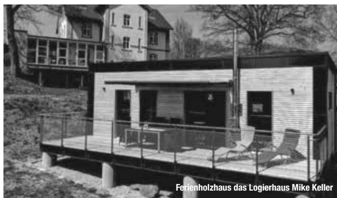
Ferienholzhaus das Logierhaus Mike Keller

Das LEGOLAND® Discovery Centre Berlin ist der ultimative Indoor LEGO® Spielplatz für Familien mit Kindern von 3-10 Jahren. Mit aufregenden Fahrgeschäften, thematischen Spielbereichen und einem 4D-Kino. treffpunktdeutschland.de/berlin