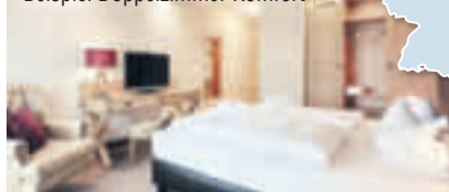
Beispiel Doppelzimmer Komfort