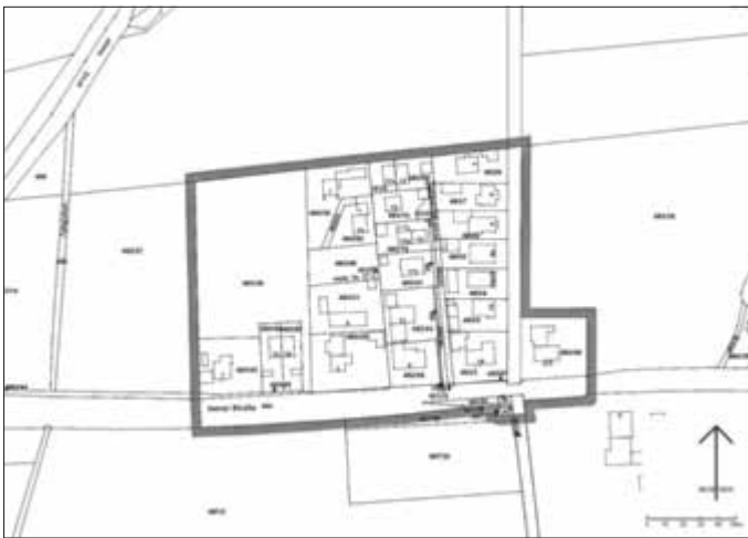
Kartengrundlage Geobasisdaten © Bayerische Vermessungsverwaltung 2020

Der Geltungsbereich des Bebauungsplans ist auch aus nachfolgendem Lageplan ersichtlich, der Bestandteil der Bekanntmachung ist: