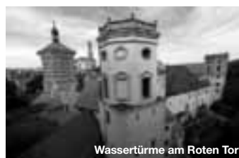
Wassertürme am Roten Tor