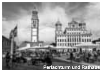
Perlachturm und Rathaus

„Augusta Vindelicum“ nannten die Römer ihre Zivilsiedlung zwischen Lech und Wertach. Daraus wurde später Augsburg, das als freie Reichsstadt im 15. und 16. Jahrhundert durch den Fernhandel und die Bankgeschäfte hier ansässiger Kaufmannsfamilien, vor allem der Fugger und Welser, zu den Weltstädten der Renaissance zählte. Noch heute erzählen viele schmucke Gebäude von der historischen Bedeutung Augsburgs, der ältesten Stadt Bayerns. Allen voran das Renaissance-Rathaus mit seinem Goldenen Saal und dem Perlachturm.