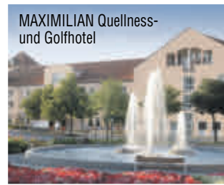
MAXIMILIAN Quellness- und Golfhotel