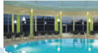
Quellness- und Golfhotel Fürstenhof