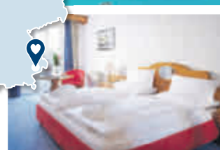
Bsp. DZ MAXIMILIAN Quellness- u. Golfhotel