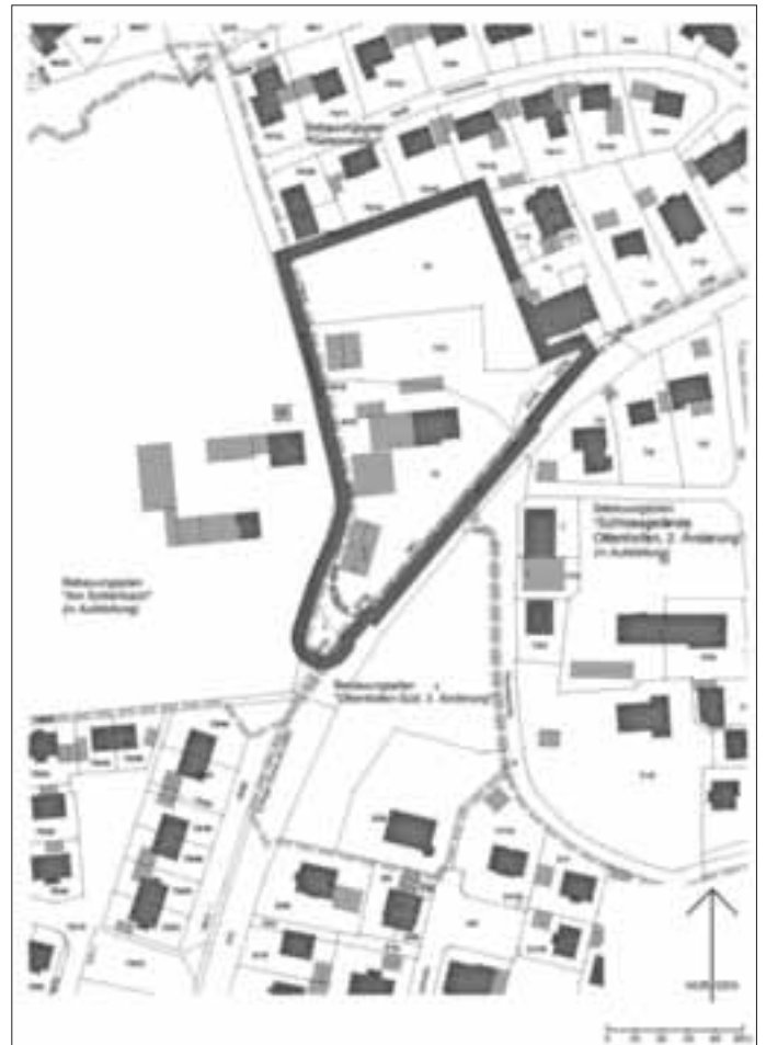
Kartengrundlage Geobasisdaten, © Bayerische Vermessungsverwaltung 04/2020

Geltungsbereich der Veränderungssperre - nicht maßstabsgerecht: