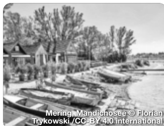
Mering, Mandichosee