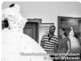
Wasserschloss Unterwittelsbach