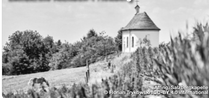
Affing, Salzbergkapelle

Der Wiege Altbayerns. Das „Wittelsbacher Land“, so nennt sich der Landkreis Aichach-Friedberg, verdankt seinen Namensgebern eine reichhaltige Geschichte. Die 1209 zerstörte „Burg Wittelsbach“ ist der ehemalige Stammsitz der Wittelsbacher – und auch wenn heute von der ehemaligen Burg nur noch Mauerreste übrig sind, so verweisen doch viele andere Sehenswürdigkeiten auf dieses Herrschergeschlecht. Die beiden charmanten Herzogstädte Aichach und Friedberg, prachtvolle Schlösser oder barocke Wallfahrtskirchen laden Dich herzlich zu einem Besuch ein. Zugleich bietet die malerische Landschaft die perfekte Umgebung für eine Freizeitaktivitäten wie etwa Wandern, Radfahren oder Familienausflüge. TreffpunktDeutschland.de/wittelsbacher-land