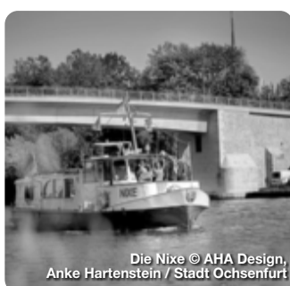
Die Nixe © AHA Design, Anke Hartenstein / Stadt Ochsenfurt