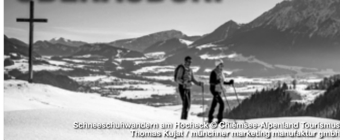
Schneeschuhwandern am Hocheck

Wenn die Wintersonne den Schnee glitzern lässt, als wären tausende von Diamanten verstreut. Wenn die weiße Pracht das Herz des Wintersportlers höherschlagen lässt und das atemberaubende Bergpanorama in einem die Sprache verschlägt - dann beginnt er: der Winter im idyllischen Oberaudorf. Der kleine Luftkurort Oberaudorf im Voralpenland bietet jede Menge Wintererlebnisse fern ab von großen Touristenmassen. Zur Auswahl stehen bestens präparierte Pisten, kurvenreiche Rodelbahnen, aussichtsreiche Langlaufloipen sowie spannende Fackelwanderungen. Wellnessangebote, Gaumenfreuden und diverse Einkaufsmöglichkeiten machen Oberaudorf zu einem optimalen und einzigartigen Winter-Urlaubsort.