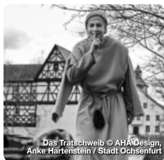
Das Tratschweib © AHA Design, Anke Hartenstein / Stadt Ochsenfurt