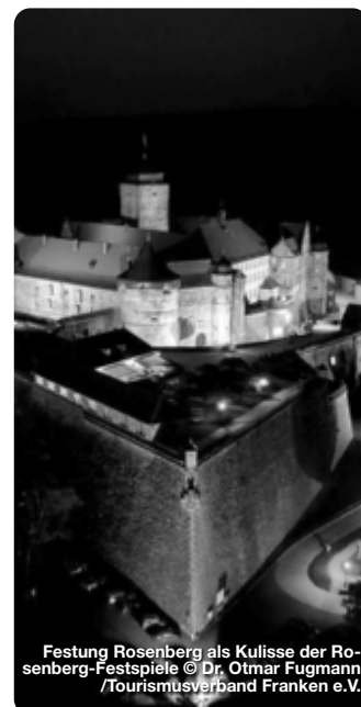
Festung Rosenberg als Kulisse der Rosenberg-Festspiele